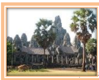
Photo : temples Bayon

Angkor-Thom qui se compose de : Le Bayon, le Baphuon, la Terrasse des éléphants, l'ancien Palais Royal, la Terrasse du roi lépreux, le Phimeanakas, le Chau Say Tevada, le Thommanon, le Tanei et le Takéo (L'ensemble de ces sites se situe dans un périmètre restreint)